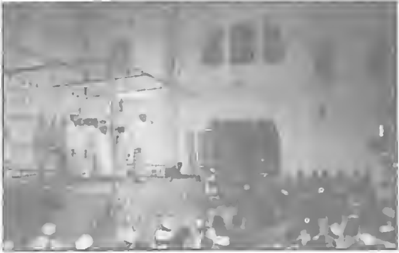
جانبا آخر من الاحتفالات وتظهر في أعلى الصورة الغرفة الرئيسية للمنصب لاستقبال الضيوف